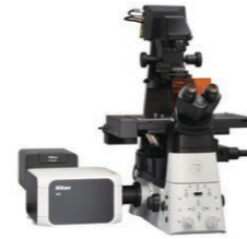
超解像共焦点レーザー顕微鏡システム [AX with NSPARC]

露光前の全てのウェハでグリッド歪みを高速計測。フィードフォワードで高精度な重ね合わせ補正が可能となり、半導体製造の歩留まり向上や設備投資効率の向上に寄与。