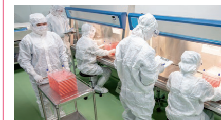
細胞受託開発・生産サービス

眼底の約80%の領域をカバーする超広角画像と、超広角画像内の任意の位置での網膜断面画像を1台で撮影可能。