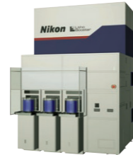
アライメントステーション [Litho Booster]

最先端プロセス量産用。高機能アライメントステーション「inline Alignment Station (IAS)」を搭載。業界最高水準の重ね合わせ精度と生産性を実現。