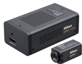
超小型マシンビジョンカメラ「LuFact」 デジタルカメラで長年積み重ねてきた独自の画像処理技術から生まれたマシンビジョンカメラ。

高精度な材料加工技術と計測・検査技術でものづくりを革新するデジタルマニュファクチャリング事業。「Lasermeister」シリーズをはじめとする光加工機によって付加加工や除去加工など、さまざまな材料加工を高精度かつ容易に。また、X線/CT検査装置、レーザーレーダ、画像測定システムといった計測・検査技術によって製造プロセスの自動化に貢献し、業務効率の改善と製造品質の向上に寄与。これら製造業の幅広いニーズに対応する技術で、デジタルマニュファクチャリングの価値と可能性を最大化する革新的ソリューションを生み出します。