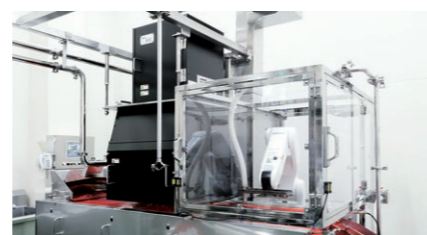
食品業界向け異物検査装置 分光技術とAIで、有機物の検出を可能に。(アヲハタ株式会社と共同開発した、ジャム・フルーツプレッドの製造工程における異物・夾雑物の自動検査を可能にした「ジャム・フルーツプレッド用異物検査装置」)