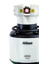
レーザーレーダ「APDIS」 自動車の小型部品から航空機の大型組立部品まで、対象物を非接触で3D計測し、生産性の向上に貢献。