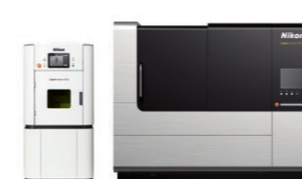
金属3Dプリンター、レーザー除去加工機「Lasermeister」シリーズ 金属積層造形から、マーキング、接合、さまざまな材料の高精度除去加工まで、材料加工の幅広いニーズに応える豊富なラインナップを提供。