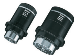
インテリジェントアクチュエータユニット「C3 eMotion」 モータ、減速機、ドライバ、ブレーキ、エンコーダを一体化させた協働ロボット用関節ユニット。