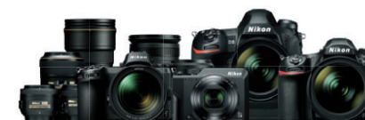
デジタル一眼レフカメラ「D6」

一眼レフカメラ、ミラーレスカメラ、コンパクトデジタルカメラなど、撮る喜びを実感できるカメラや交換レンズをラインナップ。