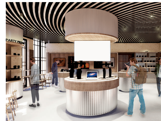
カメラを自由に手に取って映像体験を楽しめる「タッチ・アンド・トライ」コーナー。