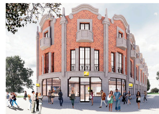
100年以上の歴史がある建造物をリノベーション。

お客さまとニコンブランドのタッチポイントを大切にしたい。オンラインの時代だからこそ、リアルで質の高い体験を提供したい。ショールームの枠を超えた新たな旗艦店には、そんなニコンの想いが込められています。製品を自由に手に取って体験できる「タッチ・アンド・トライ」、自己表現や映像への好奇心を満たすワークショップなどを提供し、若手クリエイターが情報を収集・発信できる場所を目指しています。ほかにも、お客さまとニコンの開発者をオンラインでつなぐインタラクティブな機会やお客さま同士が映像をシェアできるオンラインコミュニティなどの提供を予定。オフラインとオンラインを融合し、お客さまの声をよりよい製品やサービスの開発に活かしていきます。