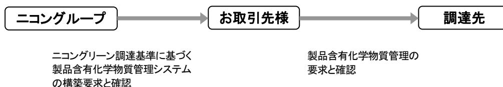
図 2 サプライチェーンにおける製品含有化学物質管理への取り組み

(注 4) 環境保全管理システムと製品含有化学物質管理システムに共通する「管理システムの構築と運用」については【資料 1】を参照願います。